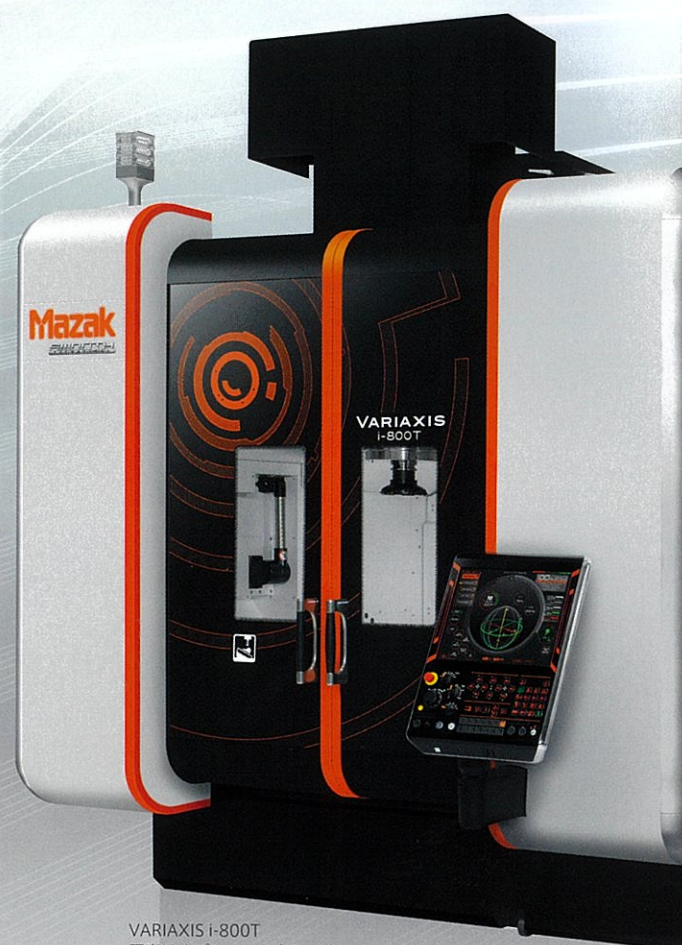
VARIAXIS i-800T 写真はオプションを含みます。