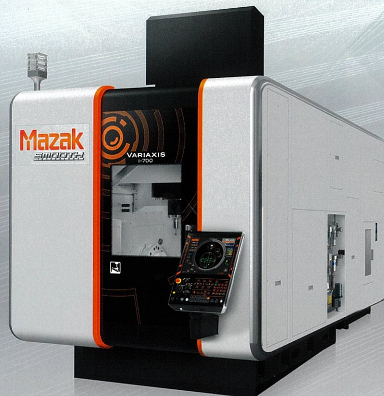
VARIAXIS i-700 写真はオプションを含みます。